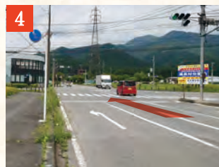
4 「関谷北」交差点を直進し、しばらく道なりに進みます。