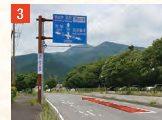
3 この先、左車線は左折専用レーンになるため、右車線を進みます。