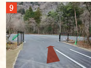
9 突き当たりを左折し、約100mほど進むと「第一駐車場」に到着です。