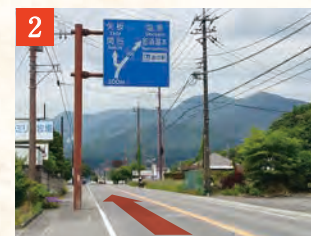
2 国道400号線を塩原・那須湯本・道の駅方面へ進みます。