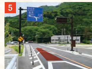
5 がま石トンネル、潜竜峡トンネルを通過し、南会津・塩原方面へ進みます。