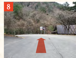
8 入口を右折進入後、突き当たりまで進みます。