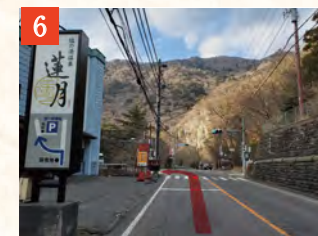
6 「福渡」交差点を左折し、福渡橋(箒川)を渡ります。