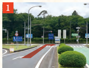
1 西那須野塩原ICを降り、料金所を通過後、突き当たりの国道400号線を右折します。

東北自動車道 西那須野塩原ICから、 塩の湯温泉 蓮月「 第一駐車場 」までのルートをご案内いたします。